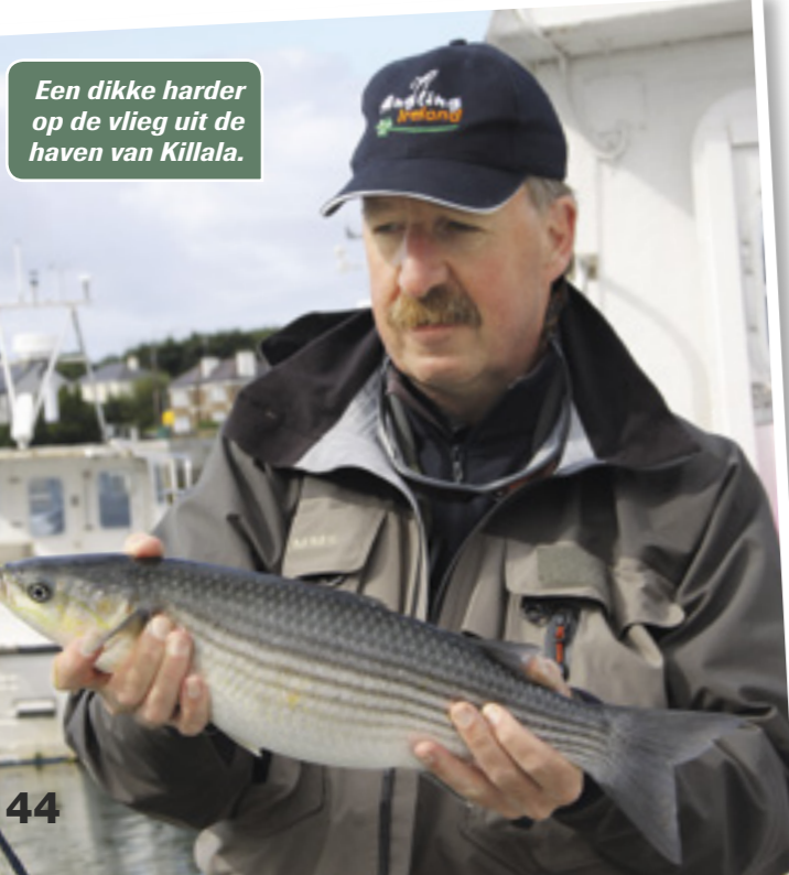
Een dikke harder op de vlieg uit de haven van Killala.