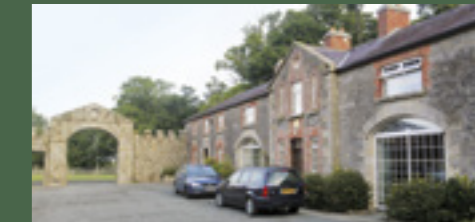
De historie van Castle Hamilton gaat terug tot de vroege Middeleeuwen.

Castle Hamilton Estate Killeshandra, Cavan Website: www.castlehamilton.com