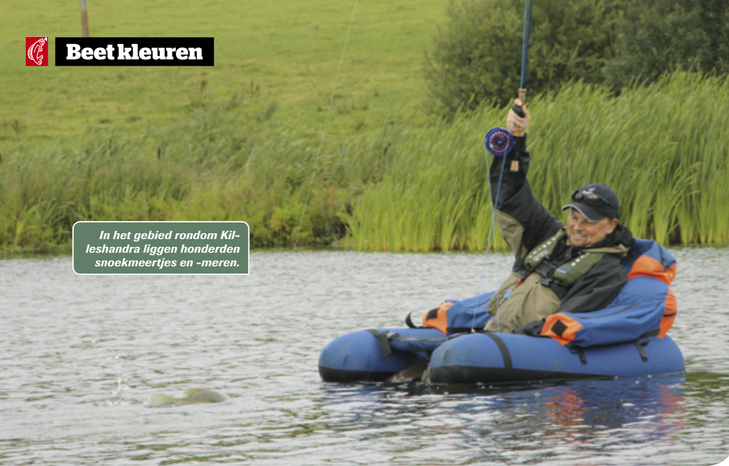
In het gebied rondom Killeshandra liggen honderden snoekmeertjes en -meren.